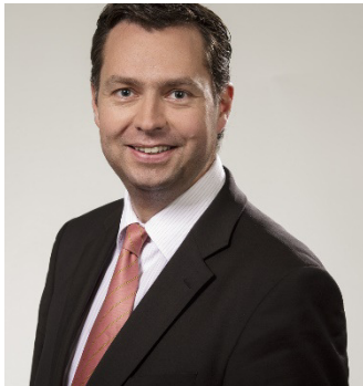
Schirmherr MdB Stephan Mayer

Gemäß den Grußworten unseres Schirmherrn, MdB Stephan Mayer, wird sportliche Aktivität in der heutigen schnelllebigen und oftmals bewegungsarmen Zeit wichtiger denn je. Sie schützt das Immunsystem und stärkt das Wohlbefinden im Allgemeinen. Laufen kann den nötigen Ausgleich zu einseitigen oder mangelnden Bewegungen im Alltag bieten.