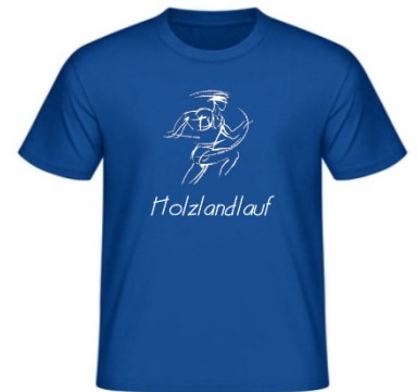
Premiere für das Holzlandlauf-T-Shirt

Die Gruppen mit den meisten Teilnehmern erhalten bei der Siegerehrung Sonderpreise. Auf die größte Firmen- und Vereinsgruppe wartet je ein 20 l Fass Bier und die größte Kindergruppe erhält Eisgutscheine.